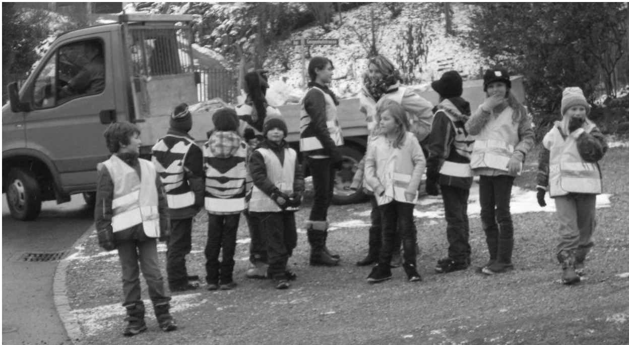
Schulkinder beim Altpapiersammeln in Eschikofen

Die Schulbehörde hat daher das Tragen von Leuchtwesten in den Wintermonaten (Herbstferien bis Frühlingsferien) für alle Schülerinnen und Schüler als Verkehrsteilnehmer (Fussgänger, Kickboard-, Fahrradfahrer usw.) für obligatorisch erklärt.