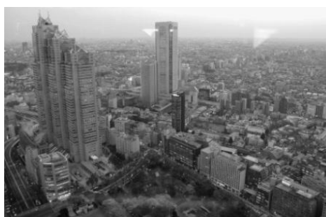
Tokyo April 2010 – Konzerttournee Mv Thurtal Hüttlingen