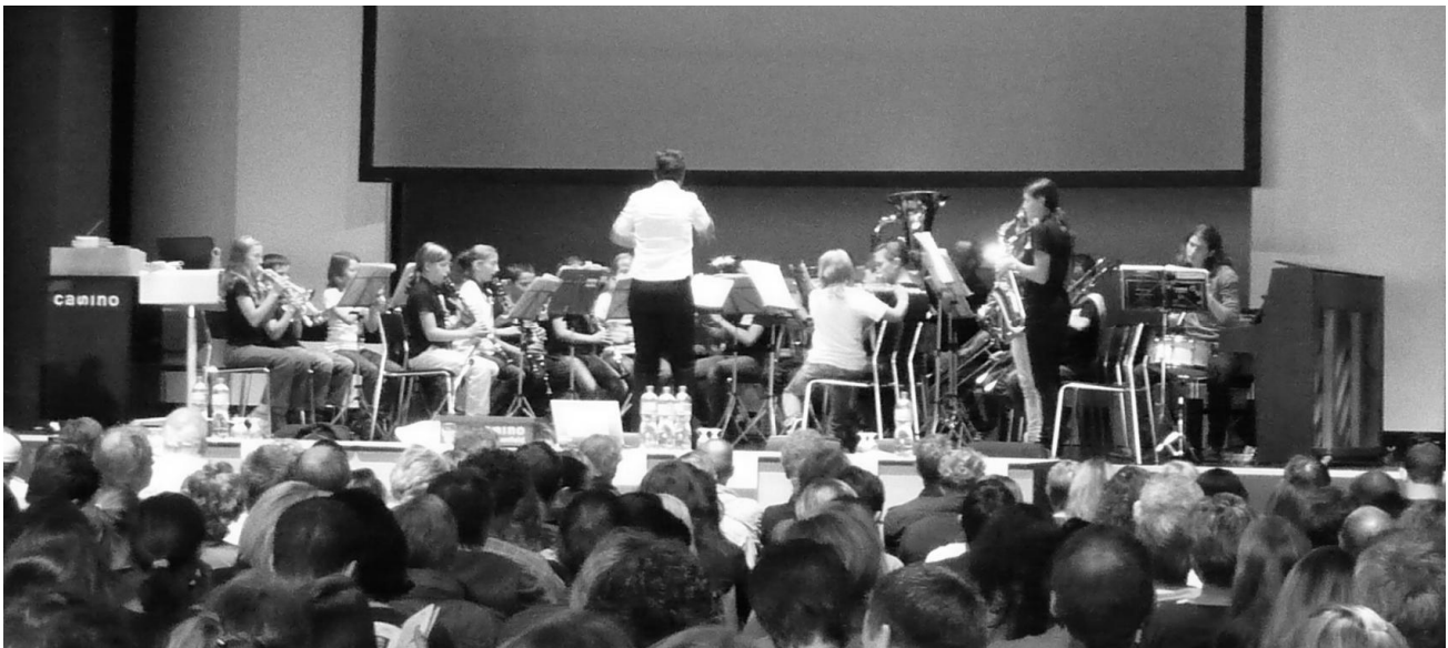
Unsere Bläserklasse an der Thurgauischen Mittelstufenlehrerkonferenz im Casino Frauenfeld